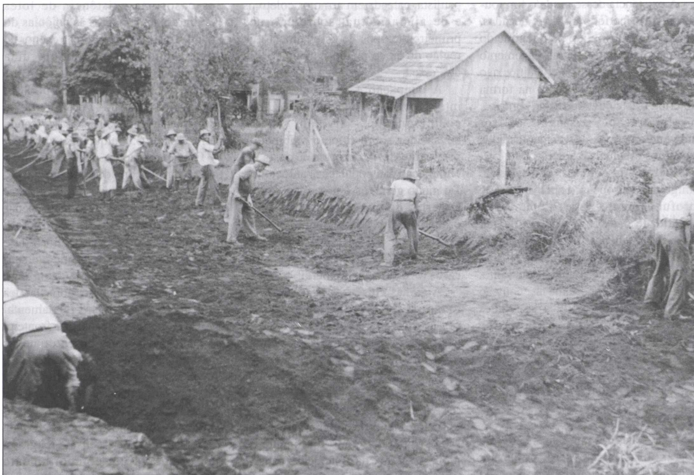
Abertura de estrada por membros da Colônia Varpa, por volta de 1930.